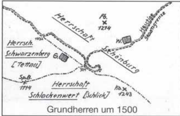
Abb. 63 Der annähernde Grenzverlauf zwischen den Grundherren von Schönburg, Schwarzenberg (Tettau) und Schlackenwerth (Schlick) W = Wiesenthal. G = Gottesgab. Fb = Fichtelberg. Kb = Keilberg. Sb = Spitzberg

Während vor der Stadtgründung die Grenzziehung zwischen diesen drei Herrschaftsgebieten in unwirtlicher Gegend keine Rolle spielte, wurde mit dem stürmisch einsetzenden Bergbaubetrieb die Situation besonders deshalb problematisch, weil die ergiebigen Silbererzgänge in Untertagestollen zum Teil „grenzüberschreitend“ verliefen. Infolgedessen wurde Ende der Zwanziger Jahre des 16. Jahrhunderts die Grenzziehung präzisiert, indem, begleitet von Streitigkeiten – besonders zwischen den Schwarzenbergern und den Schönburgern – und einem regen amtlichen Schriftwechsel, die „Herren Besitzer“ selbst gemeinsame Grenzbegehungen durchführten und mit Hilfe von „Rainbäumen“ [48], [49-1] und anderen Markierungen die Herrschaftsgebiete absteckten und in Messkarten-Skizzen zu Papier brachten (Abb. 64).