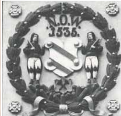
Abb. 62-1 Stadtappen der Neustadt Wiesenthal