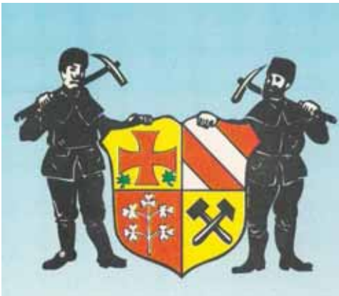
Abb. 62-2 Stadtappen von Kurort Oberwiesenthal