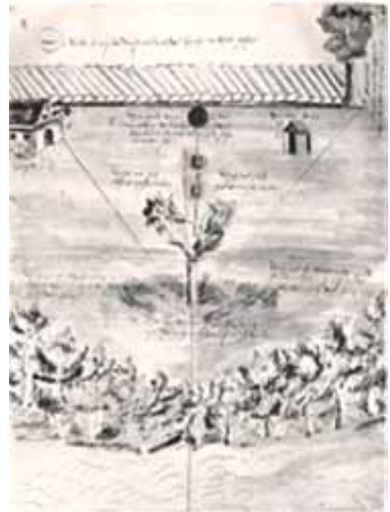
Abb. 64 Skizze des Wittenberger Hofgerichts HStA. Loc 8341 fol.93

Während vor der Stadtgründung die Grenzziehung zwischen diesen drei Herrschaftsgebieten in unwirtlicher Gegend keine Rolle spielte, wurde mit dem stürmisch einsetzenden Bergbaubetrieb die Situation besonders deshalb problematisch, weil die ergiebigen Silbererzgänge in Untertagestollen zum Teil „grenzüberschreitend“ verliefen. Infolgedessen wurde Ende der Zwanziger Jahre des 16. Jahrhunderts die Grenzziehung präzisiert, indem, begleitet von Streitigkeiten – besonders zwischen den Schwarzenbergern und den Schönburgern – und einem regen amtlichen Schriftwechsel, die „Herren Besitzer“ selbst gemeinsame Grenzbegehungen durchführten und mit Hilfe von „Rainbäumen“ [48], [49-1] und anderen Markierungen die Herrschaftsgebiete absteckten und in Messkarten-Skizzen zu Papier brachten (Abb. 64).