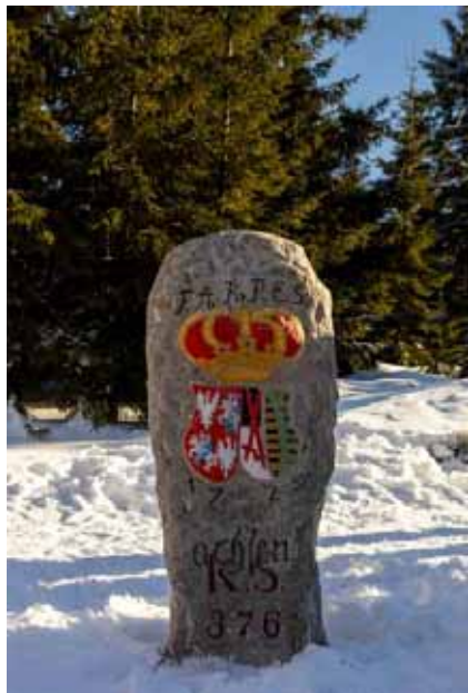
Abb.67-1 NW: Königreich Sachsen Abb.67-2 SW KrÖsterr./Kgr.Böhmen