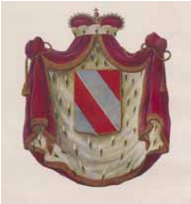
Abb. 61 Wappen der Schönburger

Bald darauf gewährte Herzog Georg von Sachsen am 19.3.1527 der Neustadt am Wyssental für sechs Jahre Bergfreiheit und mit Edikt vom 22.3.1527 gründeten Ernst II. (1486-1534) und Wolf I. (1482-1529) von Schönburg zu Glauchau und Waldenburg ( Abb. 61 ) eine neue Bergstadt: „Neustadt am Wyssental“ (auch „Neustädte“ ( Abb. 62-1 ) bzw. „Städte“ genannt) wo sich die heutige Stadt Oberwiesenthal befindet. Im aktuellen Stadt-Wappen von Kurort Oberwiesenthal ( Abb. 62-2 ) ist das Wappenschild der Schönburger erhalten geblieben. Das volle Stadtrecht erhielt die Neustadt Wyssental erst am 25.7.1588 durch Herzog Christian von Sachsen.