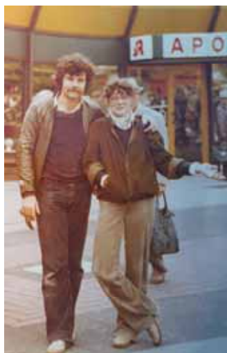
Du und ich