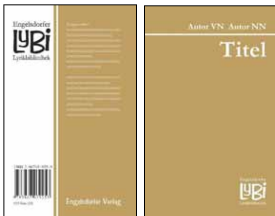
Vorder- und Rückseite der neuen Lyrikbibliothek.

Um Ihrer Lyrik und Prosa auf dem Markt eine Chance zu geben, existiert seit 2009 die Reihe „Lyrikbibliothek im Engelsdorfer Verlag“, kurz LyBi. Die Bücher erscheinen im Format 12 mal 19 (Taschenbuchformat). Als maximale Seitenzahl in diesem Format gelten 140 Seiten schwarzweiß, Schriftart ist Garamond 11 Pt. Farbseiten sollten dezent verwendet werden, in der Lyrik steht immer die Sprache im Vordergrund! Pro Farbseite muss die Seitenzahl um 10 Seiten verringert werden, damit der Preis gehalten werden kann. Die Lyrikbibliothek tritt in einem einheitlichen Erscheinungsbild auf und besitzt ein geschütztes Logo. Der Ladenpreis eines Buches beträgt 9,95 Euro. Die Grundfarbe kann variieren.