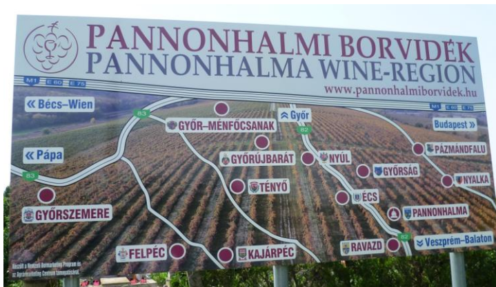
Die Pannonhalmaer Weinregion auf einem Plakat

Mein Dorf, das muss ich erklären. Mein Dorf liegt in Ungarn, in der Mitte zwischen Wien und Budapest, nicht weit vom Kloster Pannonhalma entfernt. Dieses Kloster mit seinem hohen klassizistischen Turm, seiner Kirche und den angeschlossenen Gebäuden überragt die Ebene um Győr. Győr ist eine alte Kulturstadt mit einem wunderschönen alten Zentrum. Das Kloster Pannonhalma ist auf einem pannonischen Hügel erbaut und ein Anziehungspunkt, sichtbar schon von weitem.