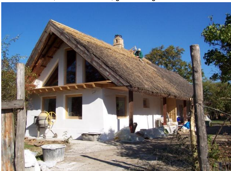
Bauernhaus im Aus- und Umbau

gen, bauten Bad, WC und Küche ein, renovierten das gesamte Haus, bauten Fenster, Türen, Fußböden und den Dachboden ein. Der Balkon wurde angebaut, damit man nach dem Kloster Pannonhalma blicken kann, das imposant hoch über uns auf dem pannonischen Hügel thront, dem Himmel so nah. Mit Ausdauer, vielen Fehlern und Selbstkorrekturen wurden WC, Bad, Küche und zwei Zimmer fertig. Auch der Lehmfußboden wurde ausgehoben, isoliert, betoniert und mit einem Holzfußboden ergänzt. Die Wände bekamen einen doppelten Kalkanstrich, auch von außen, ganz ökologisch.