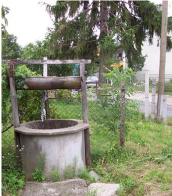
Der alte Brunnen im neuen Garten

Hier kann man so viel erleben, wenn man nur die Augen aufmacht. So herrliche Vögel gibt es im Garten, Rotschwänzchen, ewig hungrige Amseln mit zusammenfalteten Regenwürmern im Schnabel, Eichelhäher, auch Weinbergschnecken und wunderschöne Eidechsen (mindestens 10 cm lang, gestreift), nicht zu reden von den vielen Früchten, die gerade reif werden und von denen ich in unendlicher Folge Kompott oder Gelee herstelle, das unvergleichlich gut schmeckt. Auch die Erdbeerpflanzen tragen Früchte, es soll solche geben, die sogar zweimal im Jahr Früchte tragen. Man lernt nie aus.