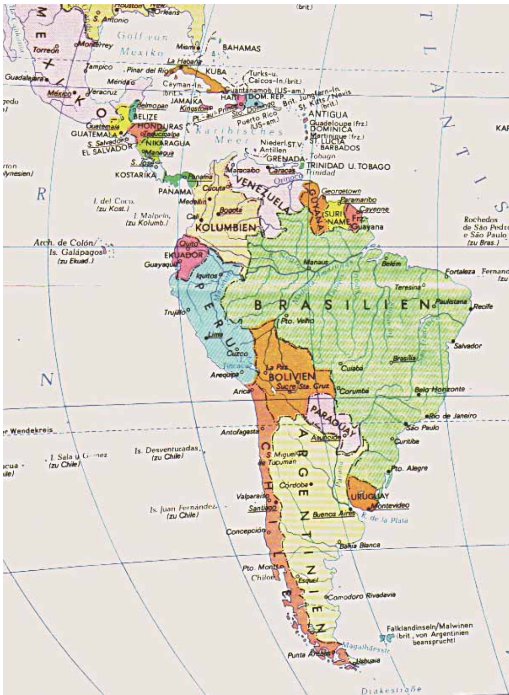
Abb. 10: Landkarte von Südamerika mit deren Hilfe der Leser die jeweiligen Reiserouten nachvollziehen kann

Die Tour führte sie nach Südwesten zur Atlantikküste, wo sich Ernesto im Seebad Miramar noch einmal mit seiner Verlobten Chichina traf und ihr zum Abschied seinen Hund „Come back“ schenkte.