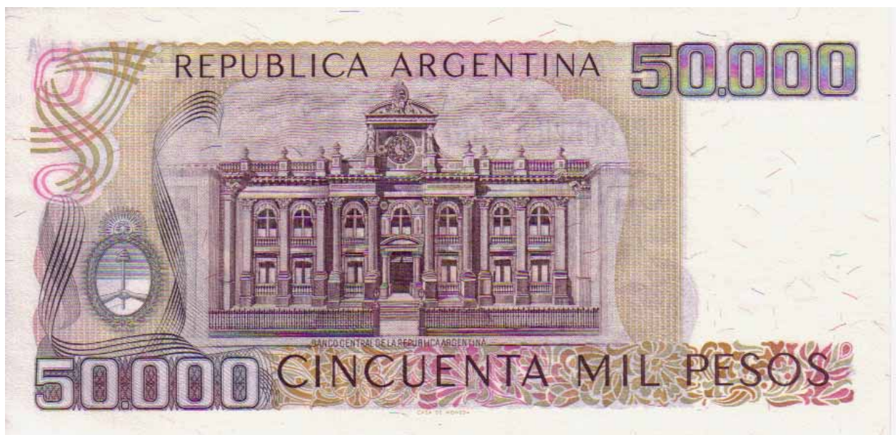
Abb. 11: Rs. der 50.000 Pesonote von 1971 mit dem Motiv: „Gebäude der Zentralbank in Buenos Aires“

Der Aufbruch erfolgte am 29. Dezember 1951 von Cordoba aus in die Hauptstadt Buenos Aires, wo der eigentliche Start am 4. Januar 1952 vor dem Zentralbankgebäude (Abb. 11) vollzogen wurde.