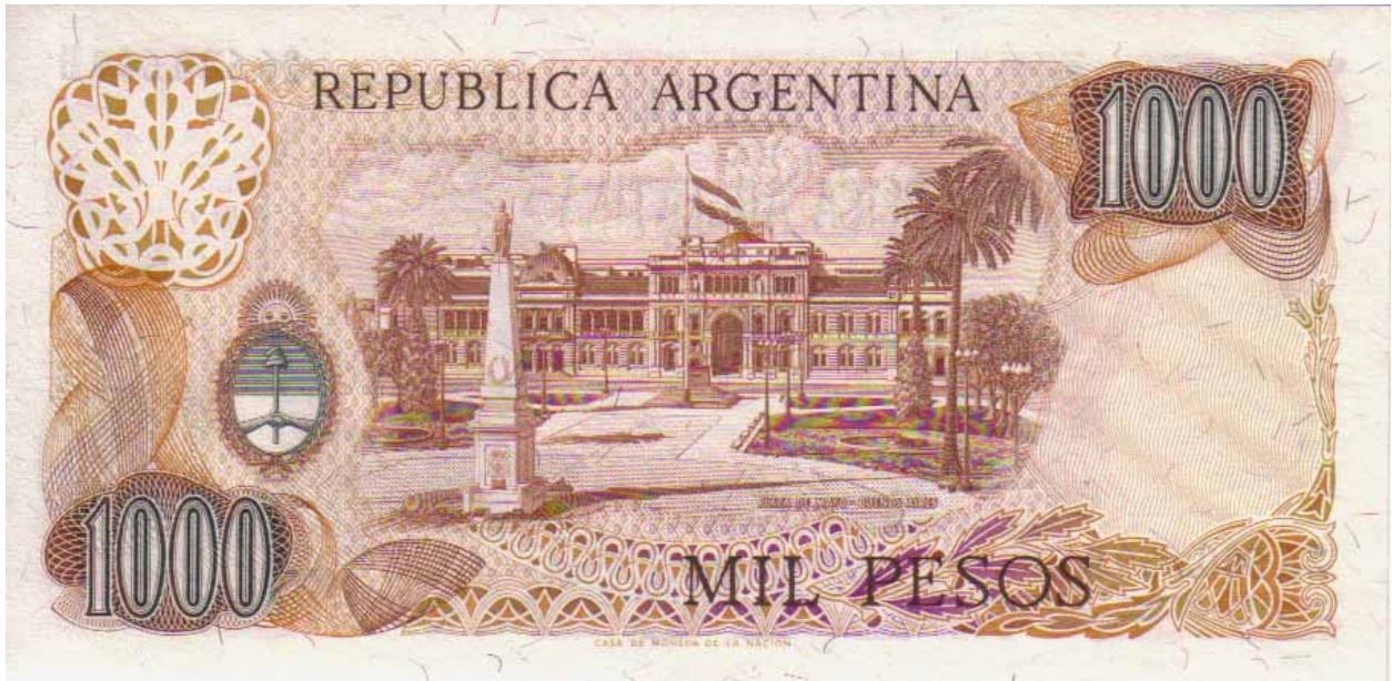
Abb. 3: Diese Banknote zu 1000 Pesos von 1976 ist der Hauptstadt Argentinien Buenos Aires mit dem Motiv: des bekannten „Plaza de Mayo“ gewidmet.