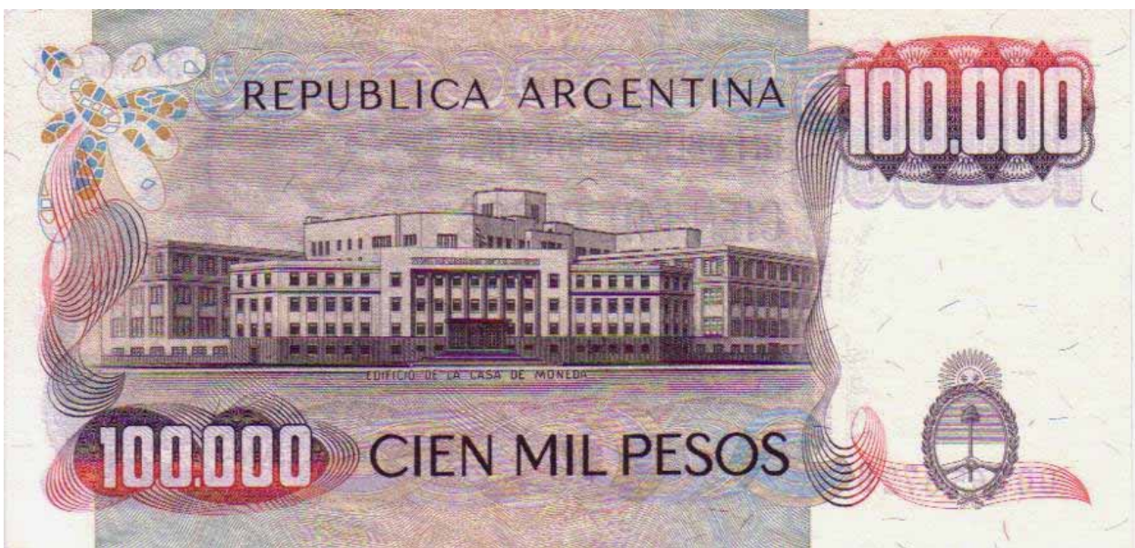
Abb. 4: Die 100.000 Pesos – Banknote von 1979 zeigt als Rückseiten-Motiv das „Edificio de la Casa Moneda“ – das Münzgebäude von Buenos Aires, dem Startort von Ernestos Fahrrad-Tour durch den Norden seiner Heimat. Die Vorderseite dieses Geldscheines zeigt – wie auch auf den nachfolgend abgebildeten 50, 500 und 10.000 Pesos-Noten – das Porträt von General Jose de San Martin.

Nach einer kleinen Pause legte Ernesto – wie seinen Eltern vor der Fahrt versprochen – die drei noch anstehenden Zwischen-Prüfungen bis zum Jahresende ab.