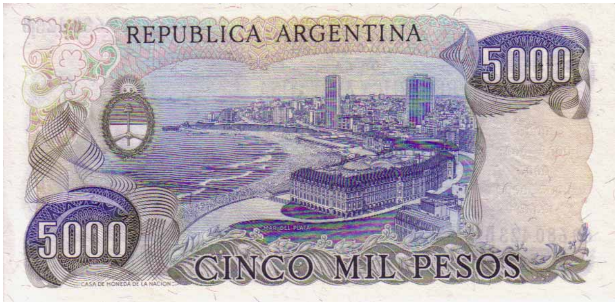
Abb. 2: Die Rückseite der 5000-Peso-Note von 1977 bringt die „Coastline of Mar del Plata“ einen bekannten Urlaubsort an der Ostküste des Atlantiks zur Ansicht.