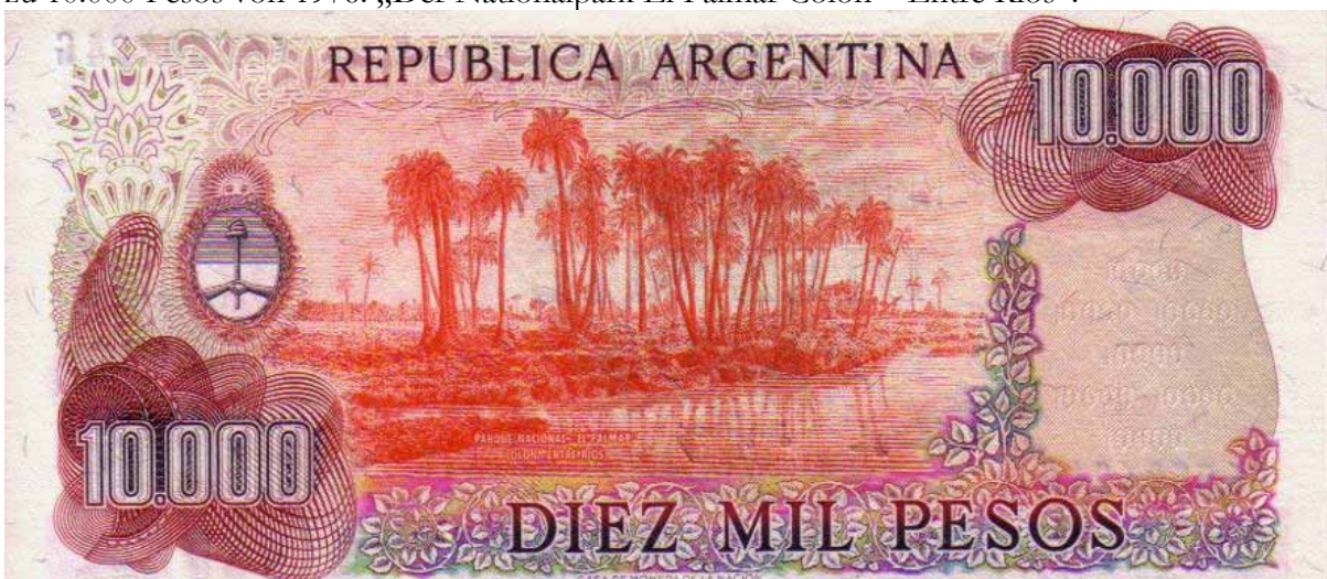
Abb. 5, 6 und 7: Die Motive der Rückseiten dieser drei Banknoten zeigen Ernestos Reisestationen

zu 10.000 Pesos von 1976: „Der Nationalpark El Palmar Colon – Entre Rios“.