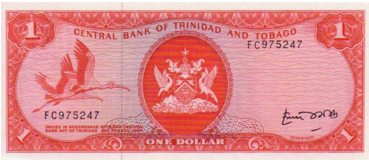
Abb. 8: Die jeweiligen Vorderseiten (Vs.) der 1 $ – Note von Trinidad & Tobago – Ausgabe 1964 – mit dem Motiv: „Two flying birds“ und der

Im Sommer 1951 heuerte Ernesto als Matrose auf einem Öltanker an und ist mit diesem vom südargentinischen Hafen Comodoro Rivadavia aus unterwegs nach der Karibikinsel Trinidad (damals britische Kolonie, seit 1962 unabhängig und ab 1976 Republik Trinidad und Tobago) und dem ehemaligen British-Guayana (wurde 1966 unabhängig und 1970 zur Republik Guayana proklamiert). (Abb. 8 und 9)